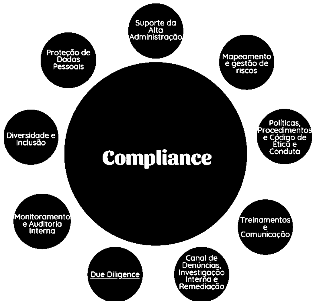
Figura 1- Pilares do Compliance

Ainda, o compliance deve se pautar em pilares básicos, de acordo com o United States Federal Sentencing Guidelines e com o que dispõe o art. 56 do Decreto n. 11.129, de 11 de julho de 2022: